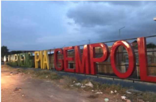
Figure 2. Papan Nama Kampung Pia

Sebagian besar penduduk di Desa Kejapanan, Kecamatan Gempol tepatnya di dusun Warurejo, membuka usaha sendiri yaitu usaha kue pia. Banyak orang di luar Dusun Warurejo menyebut tempat ini sebagai kampung pia karena banyak warga yang bertempat tinggal di tempat tersebut bermata pencaharian sebagai usahawan dengan menjual kue pia. Dengan masyarakat berwirausaha sendiri memberikan peluang besar untuk membantu mengurangi angka kemiskinan dan pengangguran yang ada di wilayah tersebut. Dengan begitu nilai ekonomi masyarakat di Dusun Warurejo dan sekitarnya semakin meningkat.