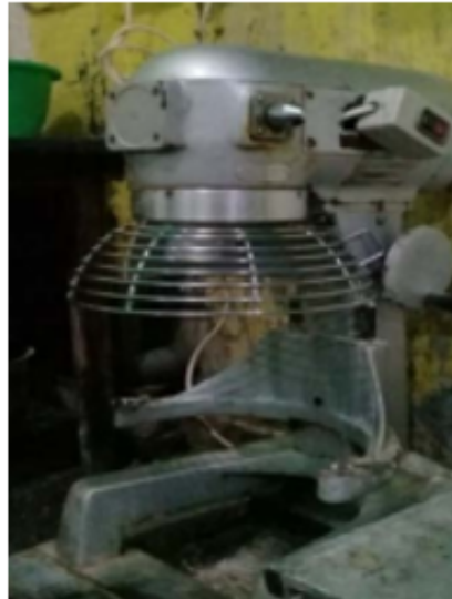
Figure 3. Alat Pembuat Adonan Kue Pia

UMKM Pia Kampung Pia dalam mempromosikan usahanya melalui whatsapp seperti membuat status dan menyebarkan promosi kepada kerabat dekat dan secara offline melalui toko yang memiliki dampak luar biasa, selain itu pelaku usaha pia membuat katalog agar konsumen langsung mengetahui produk yang dijual dengan target pasar di semua kalangan terutama kalangan ibu-ibu. Penerapan strategi yang tepat akan membawa dampak yang baik, namun apabila strategi yang diterapkan belum mampu menarik daya beli konsumen tentu akan memberikan dampak kerugian. Ada dampak positif dan juga ada yang negatif dalam setiap usaha yang didirikan. Setiap pelaku usaha tidak akan mengalami dampak kerugian pada usaha jika pemilik usaha tidak membuat strategi yang tepat agar dapat bertahan dan semakin berkembang dalam dunia industri.