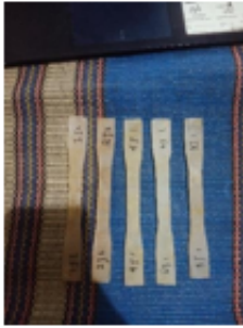
Figure 4. Spesimen komposit serat sansivera.

Setelah semua proses dilakukan mulai dari persiapan bahan lalu mengolah bahan menjadi sebuah serat hingga menjadi sebuah spesimen yang siap untuk di uji, Untuk mengetahui kekuatan dari suatu material atau spesimen tersebut.[15]