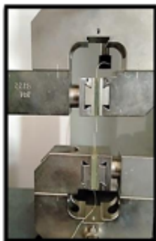
Figure 2. Uji tarik serat

Pre-load speed=150 mm/min Test speed=100 mm/min