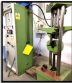
Figure 5. mesin uji tarik komposit