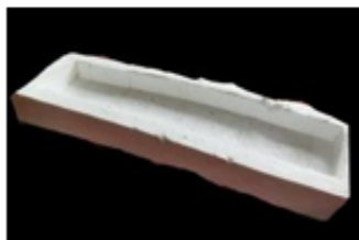
Figure 3. Cetakan serat

Setelah dilakukan pengujian tarik serat didapatkan hasil terbaik 8 jam, langkah selanjutnya adalah Pengambilan serat yang sudah direndam dengan variasi waktu selama 1,2,4,6 dan 8 jam.