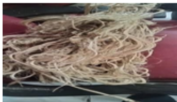
Figure 1. Serat Sansiviera

jenis serat alam yang berasal dari tanaman lidah mertua ( Sansiviera ). Pada penelitian ini peneliti melakukan seleksi terhadap daun tanaman lidah mertua yang akan digunakan, melakukan perendaman selama 30 hari, setelah proses perendaman pisahkan kulit dengan serat kemudian jemur disuhu ruangan sampai kering.