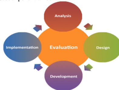
Gambar 1. 1 Prosedur Model Pengembangan ADDIE

Model penelitian dan pengembangan pada penelitian ini adalah model ADDIE ( Analysis, Design, Development, Implementation, Evaluation ). Prosedur penelitian yang dilakukan pada penelitian ini sesuai dengan model yang digunakan yakni model ADDIE. Model pengembangan ADDIE memiliki 5 langkah dalam proses pengembangan antara lain: 1) Analisis, 2) Desain 3) Pengembangan, 4) Implementasi dan, 5) Evaluasi. Tahapan tersebut dapat dijabarkan sesuai prosedur penelitian berikut: