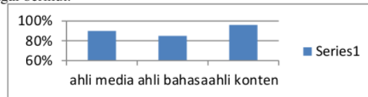
Gambar 3.1 Grafik Kelayakan Hasil Validasi Ahli

Berdasarkan hasil validasi uji ahli media, ahli bahasa, ahli materi yang telah dilakukan, secara umum dapat disimpulkan pada grafik sebagai berikut: